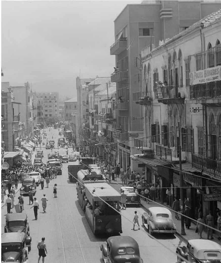
Rue Weygand, Beirut 1945

Arrak – arabischer Anisschnaps, verdünnt mit Wasser wird vor, während und nach dem Essen getrunken