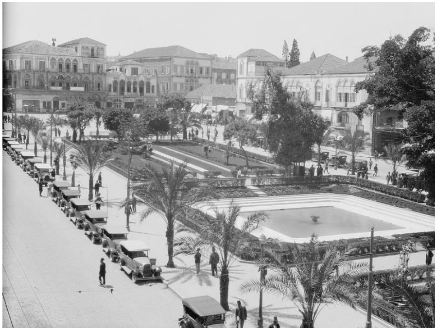
Martyrs' Square, Beirut 1930

Sämtliche Preise verstehen sich inkl. der gesetzlichen 7.7 % Mehrwertsteuer.